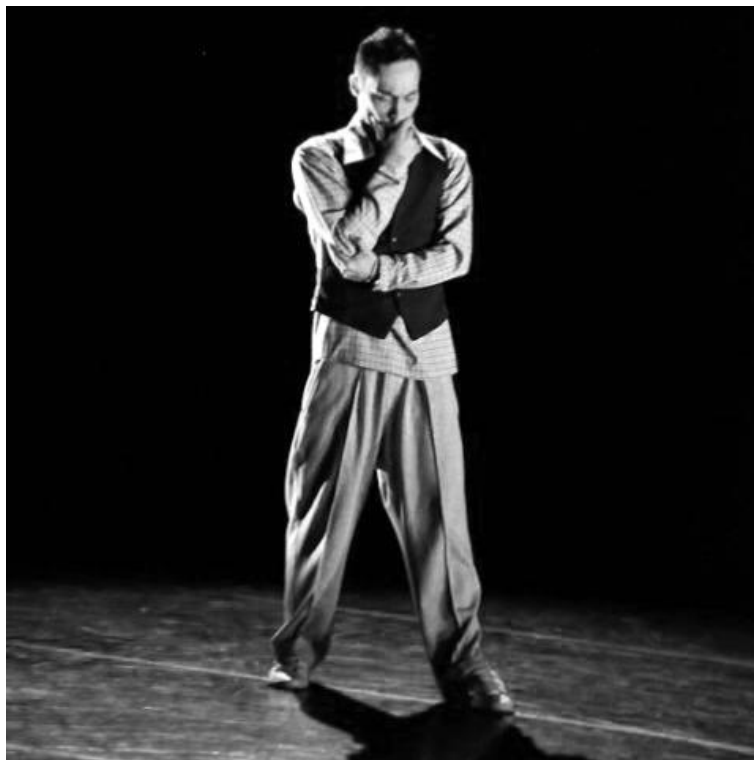
Extraits du spectacle : http://www.youtube.com/watch?v=vcxL9l_itGk

« J'ai tout compris mais faut qu'on m'explique »